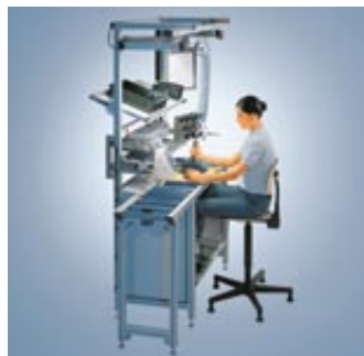
▲ Check-list da Ergonomia