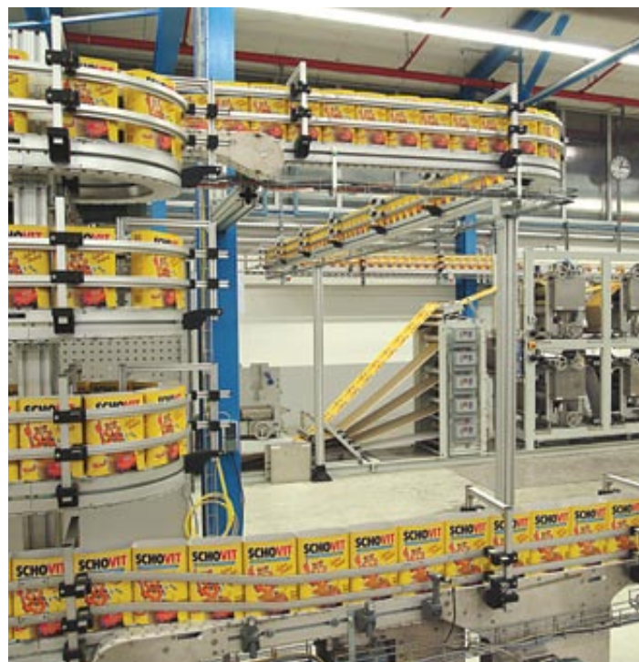
▲ Transportadores de corrente VarioFlow