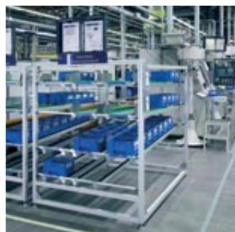
▲ MPS-Sistemas de Produção Manual