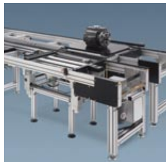
▲ Sistema Transfer